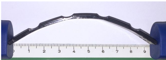
Abbildung 3: Gleitleiste SV55 – maximale Bogenbiegung (9,5 cm)