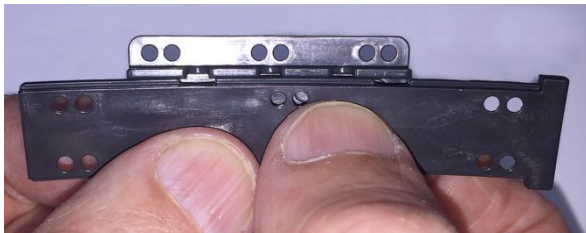
Abbildung 6: Gleitleiste in den Gleitschieber einclippen