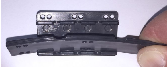
Abbildung 5: Gleitleiste an den Gleitschieber anlegen