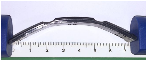
Abbildung 1: Gleitleiste SV35 – maximale Bogenbiegung (7,5 cm)