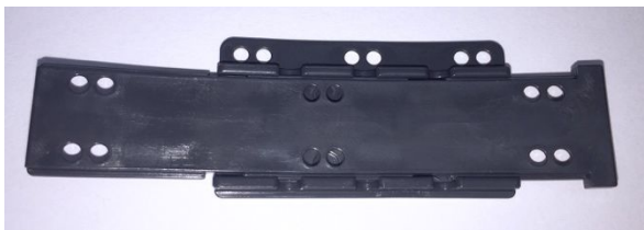
Abbildung 7: Korrekt geschlossener ComDi-Clip Schiebeverschluss